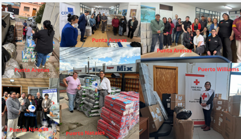
Cobertura territorial iniciativa social de apoyo a red organizaciones de voluntarios de la Region de Magallanes y de la Antartica Chilena